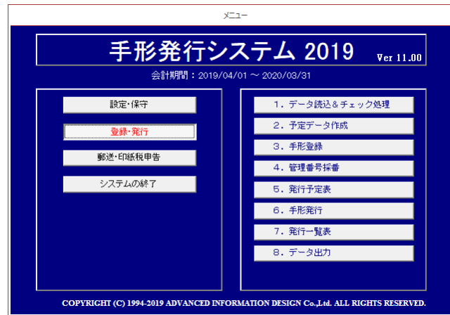
▲メニュー画面(登録・発行関連メニュー)