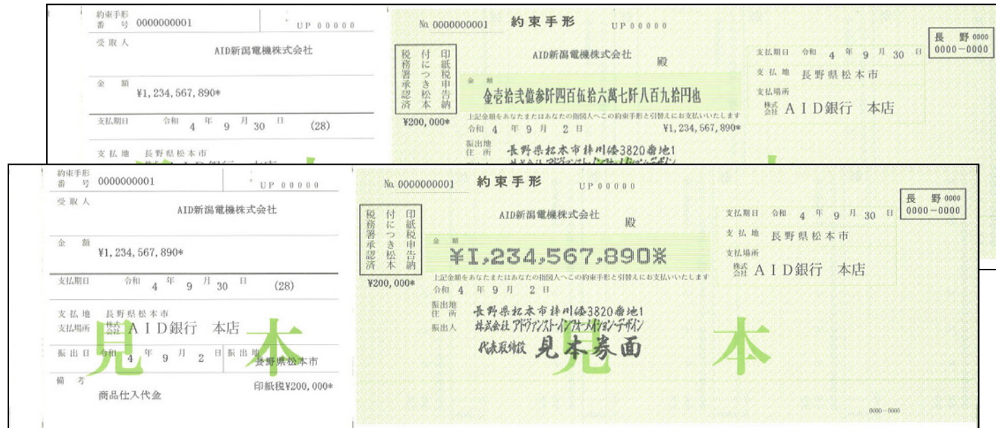
▲手形(前面:金額に算用数字を使用、背面:金額に漢数字を使用)