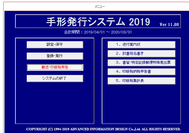
▲メニュー画面(郵送・印紙税関連メニュー)